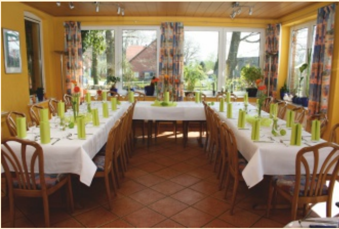
Wintergarten für maximal 36 Personen