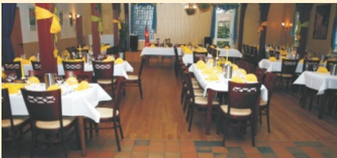
Saal für verschiedene Tafelformen, Einzeltische oder runde Tische mit bis zu 130 Personen