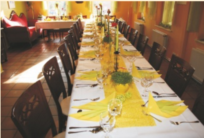
Sofazimmer hier finden 30 Gäste Platz