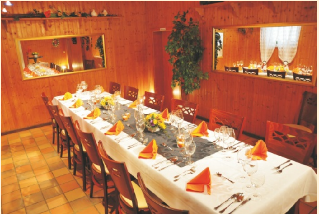
Das Konfirmationszimmer maximal 20 Personen finden hier Platz