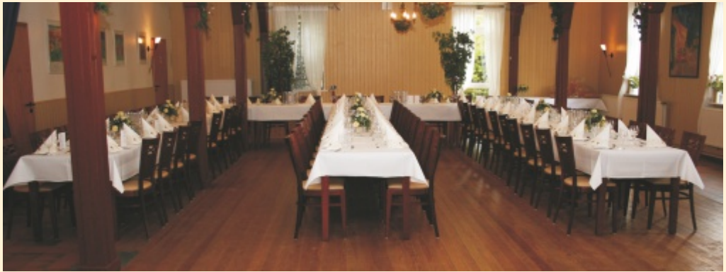
Der Saal gestellt als Tafel